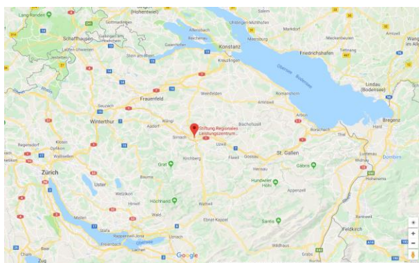
9500 Wil SG

Toggenburgerstrasse 99, 9500 Wil RLZ Ostschweiz